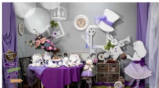
1 «ЦУМ. Всё для дома», г. Могилев